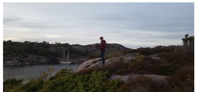
Abb 1: Dies war in Norwegen 2019